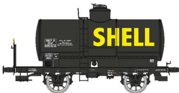
Réf. WB-707: Wagon citerne SHELL, noir, SNCF EP. III