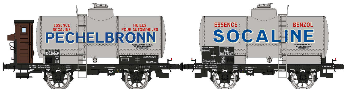
Réf. WB-704: Set de 2 citernes PEHELBRONN et SOCALINE, gris châssis noir, AL Ep. II