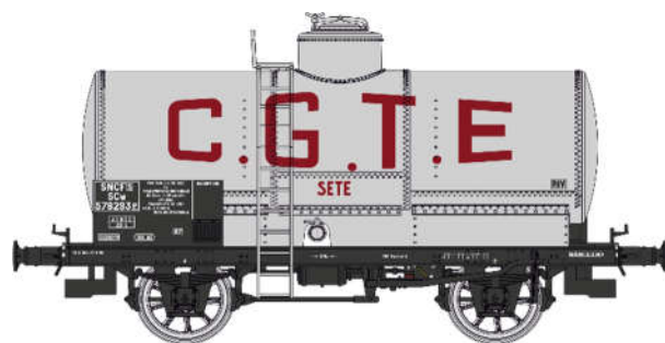
Réf. WB-709: Wagon citerne C.G.T.E. métal châssis noir, SNCF EP. III