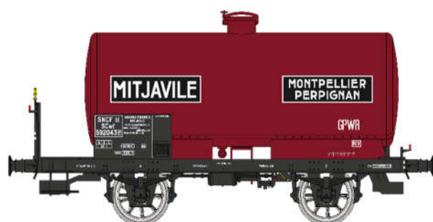
Réf. WB-711: Wagon citerne avec plateforme MITJAVILLE , rouge châssis noir, SNCF EP. III