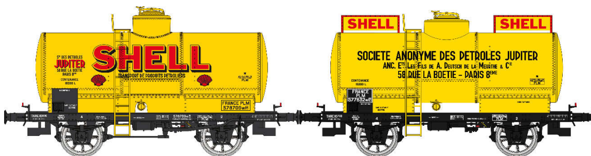
Réf. WB-705: Set de 2 citernes SHELL JUPITER, jaune châssis noir, PLM Ep. II