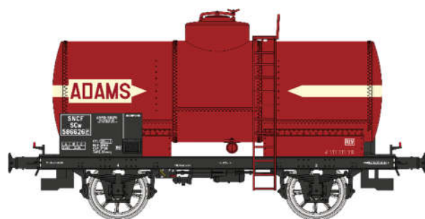
Réf. WB-708: Wagon citerne ADAMS, rouge châssis noir, SNCF EP. III