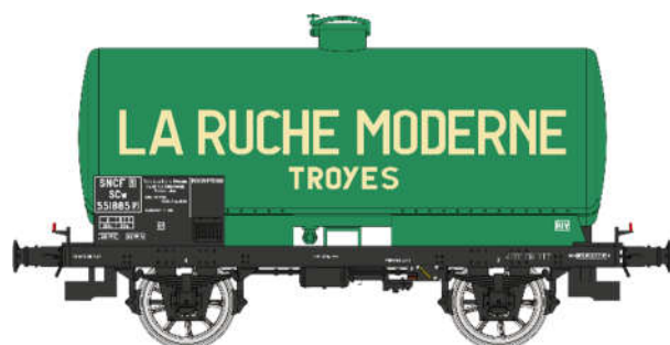
Réf. WB-710: Wagon citerne LA RUCHE MODERNE , vert châssis noir, SNCF EP. III