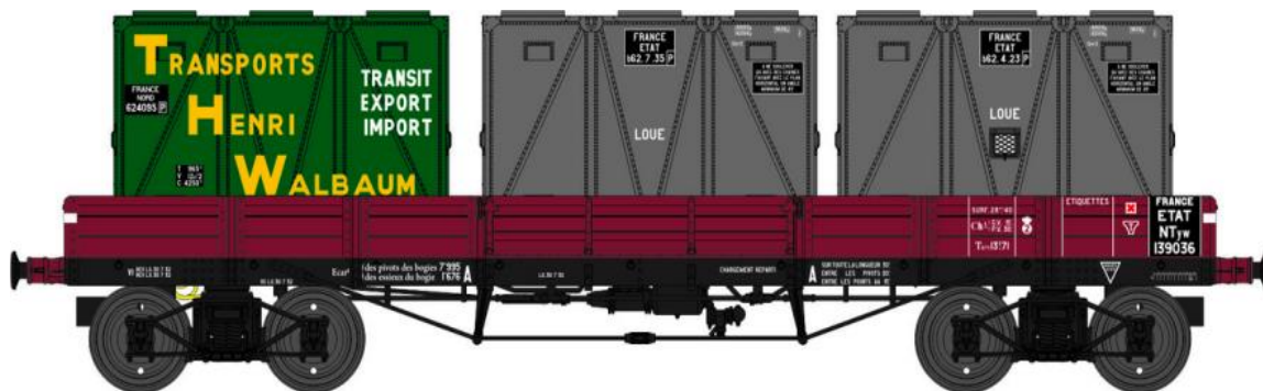
Réf. WB-422 - Wagon PLAT TP à 6 ridelles Ep.II ETAT

W028-A-04 Wagon freiné, 4 roues à rayons NTyw 12283 + 2 Cadres Anciens Réseaux