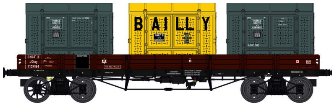
Réf. WB-424 - Wagon PLAT TP à 6 ridelles Ep.III SNCF

W028-B-04 Wagon freiné, 4 roues pleines NTyw 96312 + 2 Cadres Anciens Réseaux