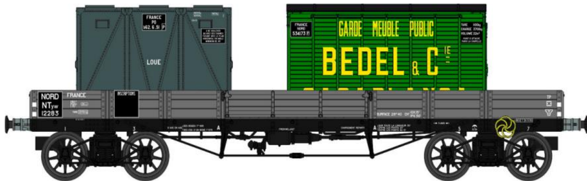
Réf. WB-421 - Wagon PLAT TP à 6 ridelles Ep.II NORD

W028-A-03 Wagon freiné, 4 roues à rayons NTyw 39103 + 3 Cadres SNCF (1938-1946)