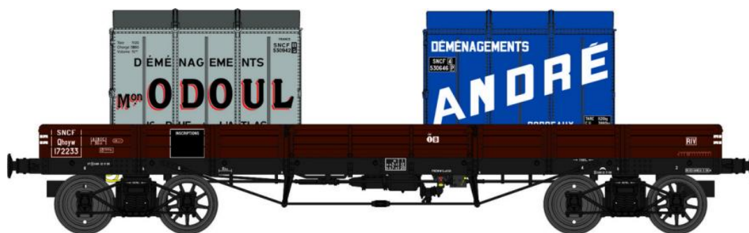
Réf. WB-427 - Wagon PLAT TP à 6 ridelles Ep.III SNCF

W028-E-03 Wagon freiné, 2 roues pleines et 2 roues à rayons Qhoyw 172233 + 2 Cadres SNCF