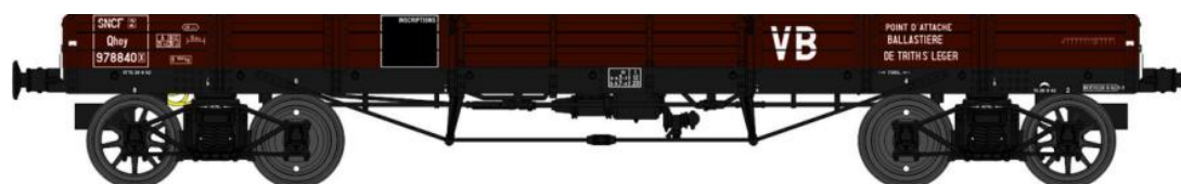
Réf. WB-428 - Wagon PLAT TP à 6 ridelles Ep.III SNCF VB

W028-E-03 Wagon freiné, 2 roues pleines et 2 roues à rayons Qhoyw 172233 + 2 Cadres SNCF