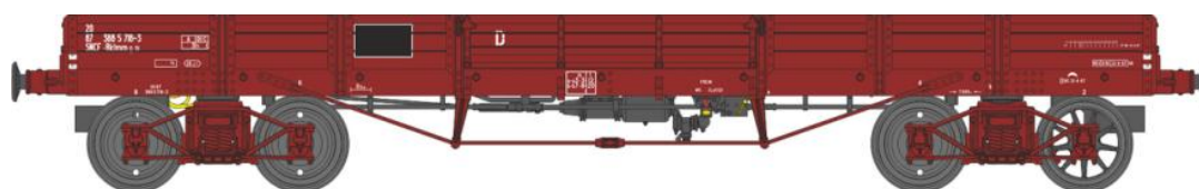
Réf. WB-429 - Wagon PLAT TP à 6 ridelles Ep.IV SNCF

W028-F-02 Wagon freiné, 2 roues pleines et 2 roues à rayons Qhoy 978840 Nouveau Numéro