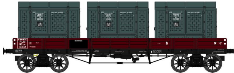
Réf. WB-420 - Wagon PLAT TP à 6 ridelles Ep.II PLM

W028-A-03 Wagon freiné, 4 roues à rayons NTyw 39103 + 3 Cadres SNCF (1938-1946)