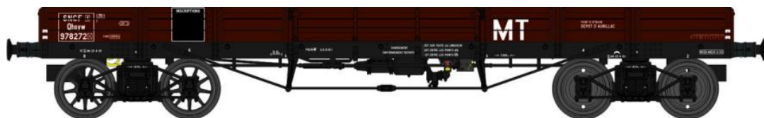
Réf. WB-425 - Wagon PLAT TP à 6 ridelles Ep.III SNCF MT

W028-C-02 Wagon freiné, 3 roues pleines et 1 roue à rayons JQhoy 7137164 + 3 Cadres SNCF