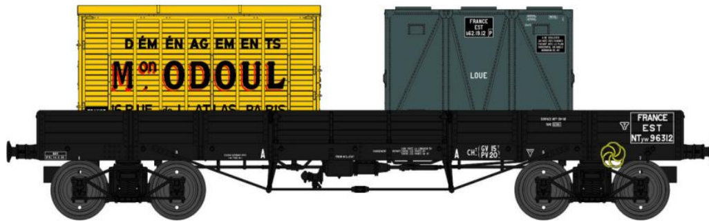
Réf. WB-423 - Wagon PLAT TP à 6 ridelles Ep.II EST

W028-B-04 Wagon freiné, 4 roues pleines NTyw 96312 + 2 Cadres Anciens Réseaux