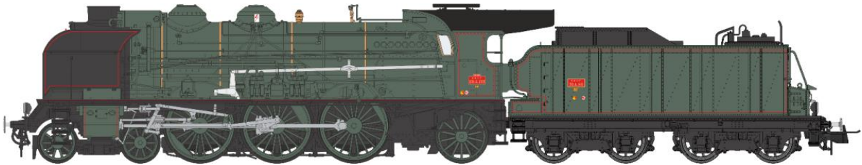
Machine 4-231 G 233 Bordeaux - toit de cabine allongé cheminée double, grands écrans fumée, pompe Bi-Compound, ACFI, tender 30m 3 , machine et tender Vert, filets rouges.

Réf. MB-046 - Vapeur 4-231 G 233 BORDEAUX, Ep.III, Analogique