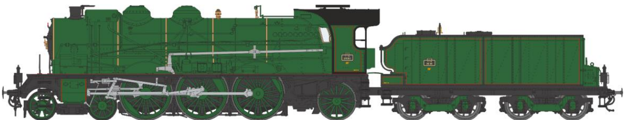
Machine 231 B 11 PLM - cheminée simple, sans écrans fumée, pompe Fives-Lille, ACFI, tender 30m 3 sans hotte.

Réf. MB-047 SAC - Vapeur 5-231 H 8 SNCF VENISSIEUX, DCC Sonorisée - Fumée Pulsée 3 Rails