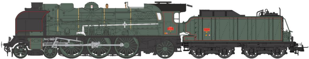
Machine 5-231 H 8 SNCF VENISSIEUX (Machine Préservée) - cheminée double, grands écrans fumée, pompe Bi-Compound, ACFI, dôme vapeur spécifique, tender 30m 3 , Vert SNCF filets rouges.

Réf. MB-046 SAC - Vapeur 4-231 G 233 BORDEAUX, Ep.III, DCC Sonorisée - Fumée Pulsée - 3 Rails