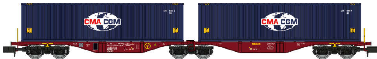
NW-288 – Wagon Sggrss 80 TOUAX + 2 conteneurs 40' CGA-CGM logo « Monde », Ep.VI

Une seconde série de wagon double Sggrss pour le transport de containers de 40 pieds est prochainement disponible. Cette série comporte les containers avec des décorations d'entreprises françaises CMA-CGM, DELMAS et MARFRET.