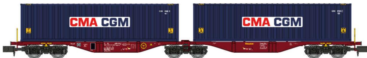
NW-289 – Wagon Sggrss 80 TOUAX + 2 conteneurs 40' CGA-CGM, Ep.VI