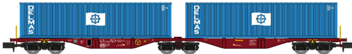
NW-290 – Wagon Sggrss 80 TOUAX + 2 conteneurs 40' DELMAS, Ep.VI