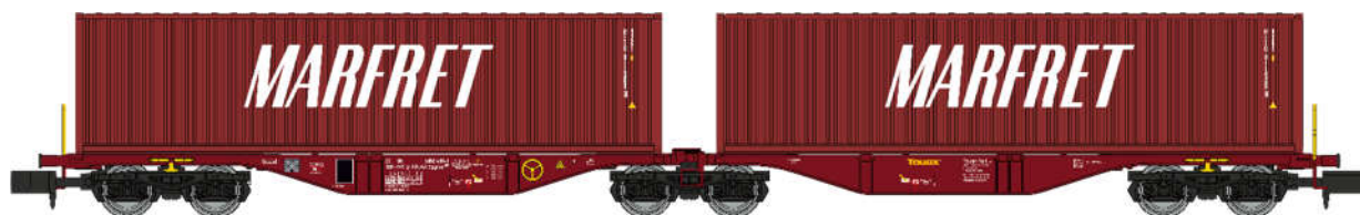
NW-292 – Wagon Sggrss 80 TOUAX + 2 conteneurs 40' MARFRET bruns, Ep.VI