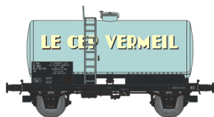
Réf. WB-032 - Wagon Citerne Ep.IV Rédition W-007-I-02 - Citerne soudée, boîtes d’essieux à rouleaux, freiné, ‘LE CEP VERMEIL’