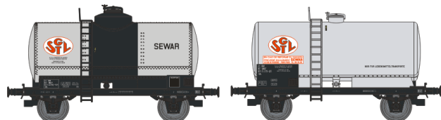
Réf. WB-034 - SET de 2 Wagons Citerne Ep.IV Rédition W-006-C-01 – Citerne rivetée, boîtes d’essieux à coussinets, non freiné, ‘SGTL’ W-007-H-01 - Citerne soudée, boîtes d’essieux à rouleaux, non freiné, ‘SGTL’