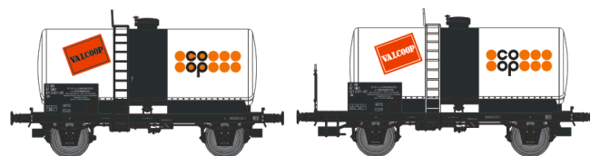
Réf. WB-033.1 - SET de 2 Wagons Citerne Ep.IV Rédition Nouveau N° W-007-I-05 - Citerne soudée, boîtes d’essieux à rouleaux, freiné, ‘COOP’ W-007-G-03 - Citerne soudée, boîtes d’essieux à rouleaux, plateforme serre-freins, ‘COOP’