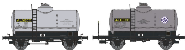
Réf. WB-028.1 - SET de 2 Wagons Citerne Ep.III Rédition Nouveau N° W-006-B-04 – Citerne rivetée, boîtes d’essieux à coussinets, freiné, ‘ALGECO’ W-006-F-03 – Citerne rivetée, boîtes d’essieux à coussinets, plateforme serre-freins, ‘ALGECO-AZUR’