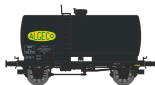
Réf. WB-030.1 - Wagon Citerne Ep.III Rédition Nouveau N° W-007-B-04 - Citerne rivetée, boîtes d’essieux à coussinets, freiné, ‘ALGECO’